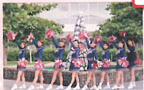
名桜大学応援団 チアリーディング部