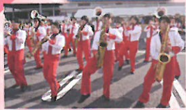
西原高校マーチングバンド部