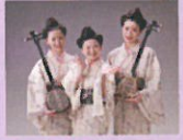
ゆいゆいシスターズ